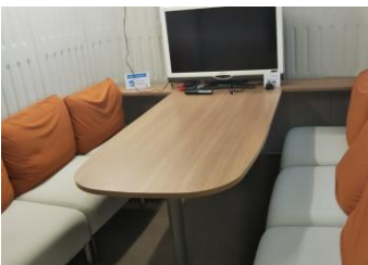
ミーティングセット